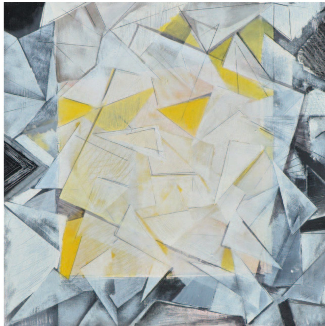
Naila Ibupoto Bez tytułu 80x80 cm akryl na płótnie