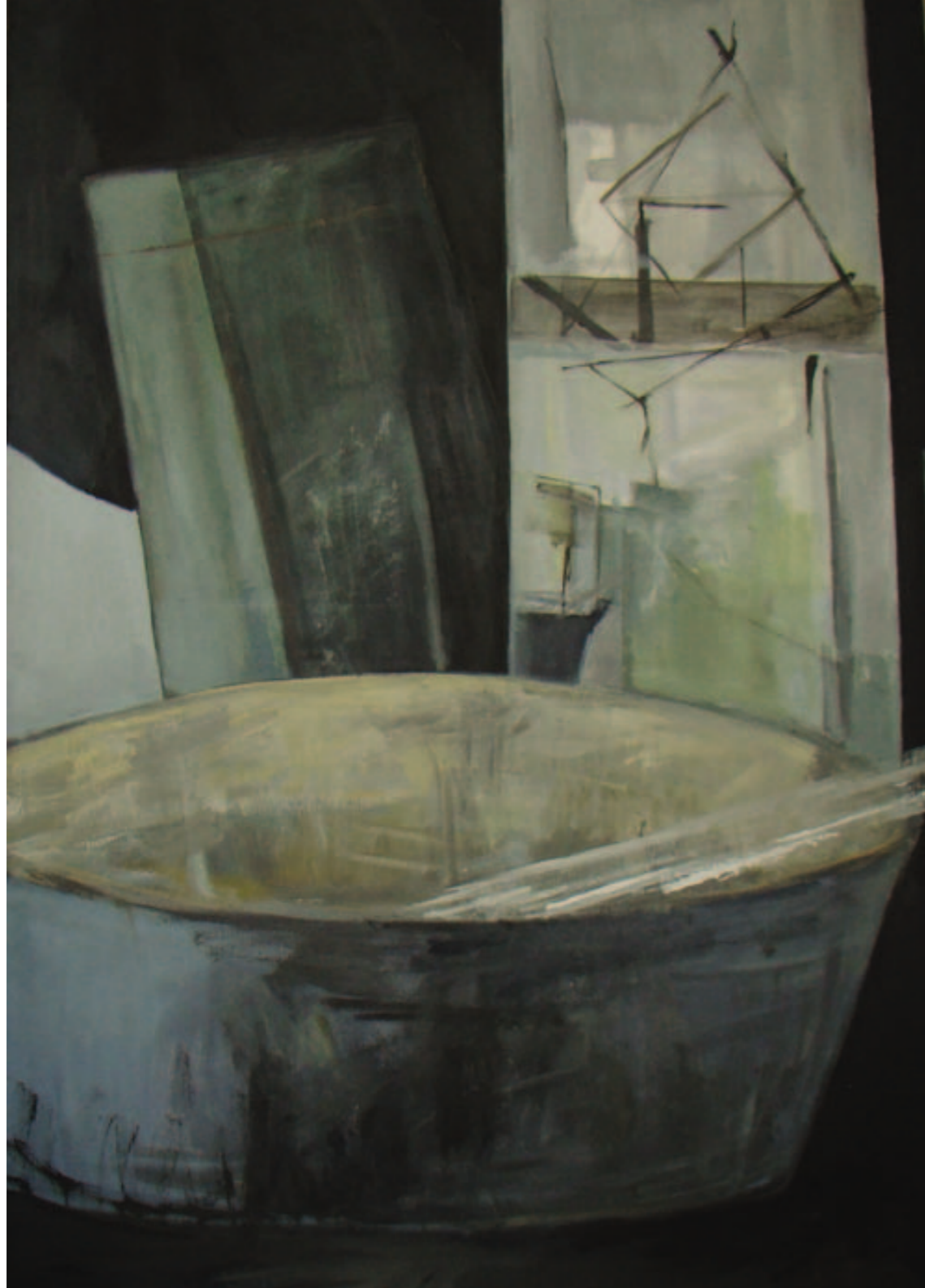
Julia Idasiak Odbicia 120x80 cm, 2014 akryl na płótnie