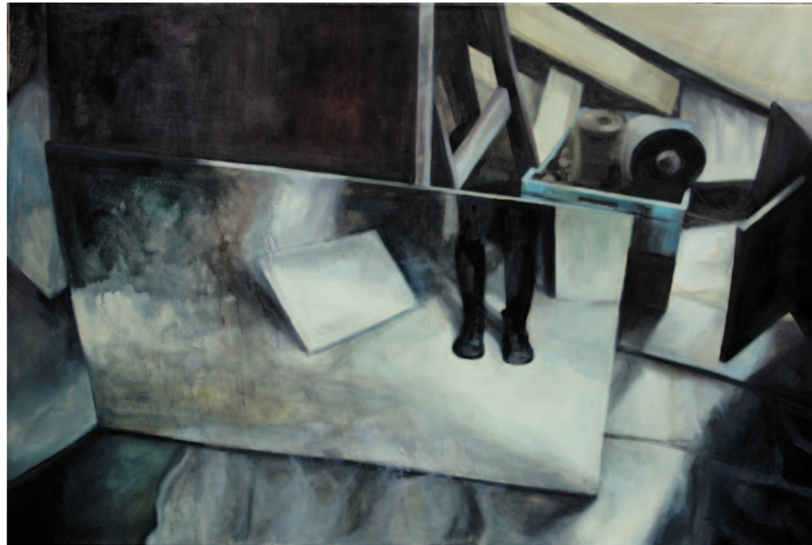
Marta Węgiel Ślady niepamięci II 80x120 cm olej na płótnie