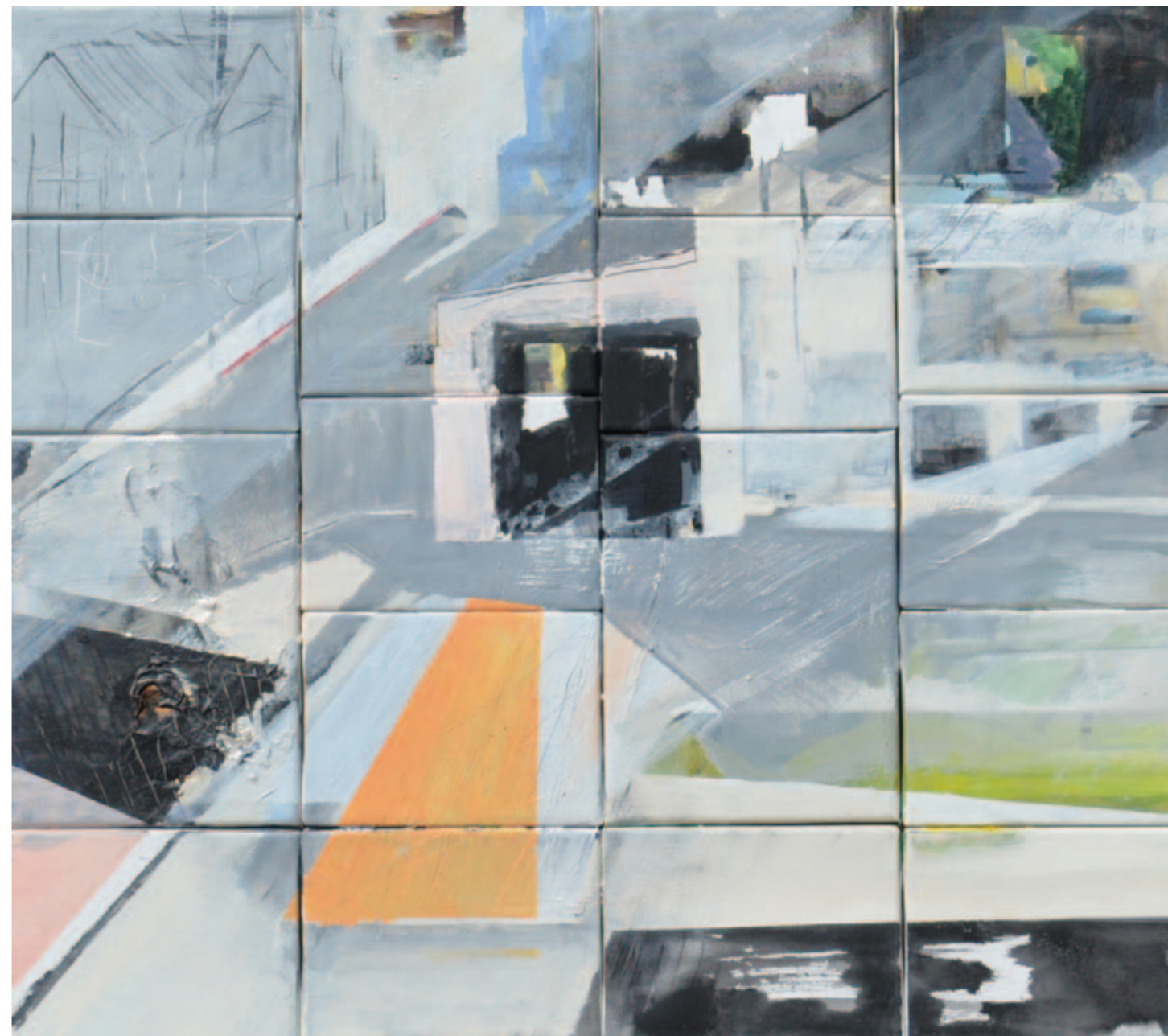
Naila Ibupoto Bez tytułu 64x73 cm akryl na płótnie