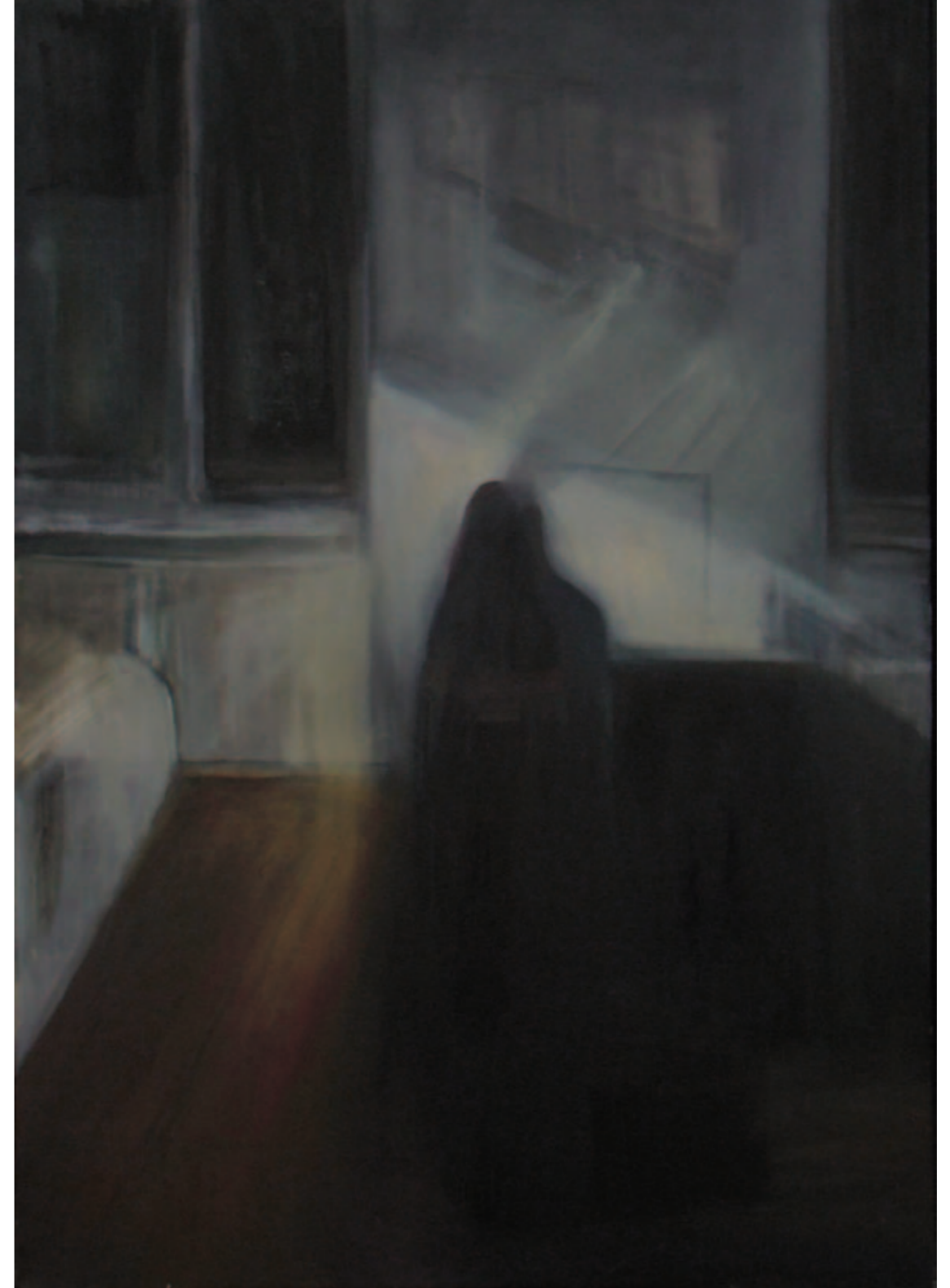
Julia Idasiak Obecny 100x70 cm, 2015 akryl i olej na płótnie