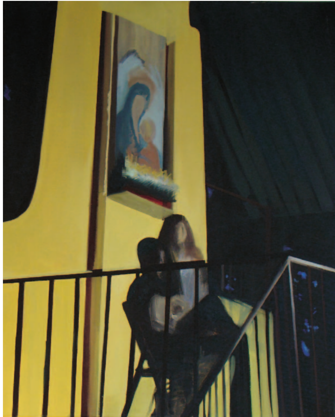
Julia Idasiak Czuwanie 80x60 cm, 2014 olej na płótnie