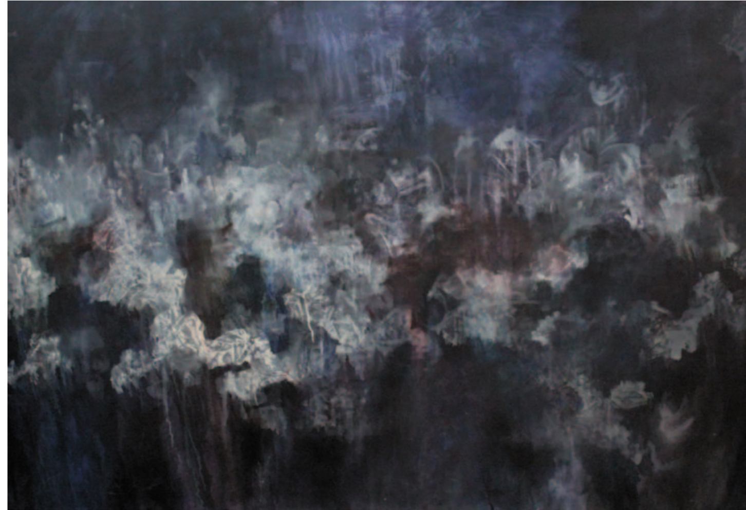
Marta Węgiel Nieuchwytna 80x120 cm olej na płótnie