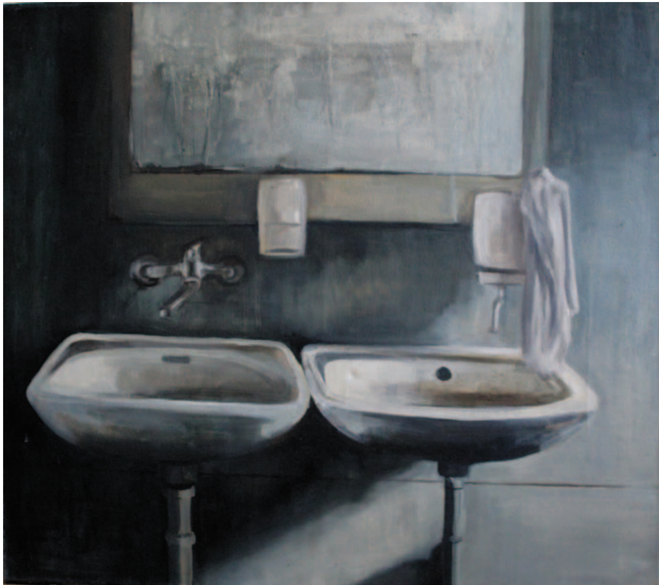
Marta Węgiel Ślady niepamięci I 80x90 cm olej na płótnie