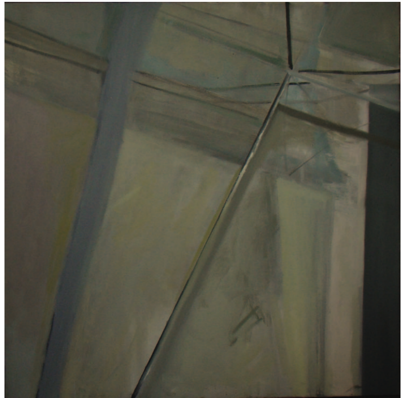
Julia Idasiak Refleksy 100x100 cm, 2014 olej na płótnie