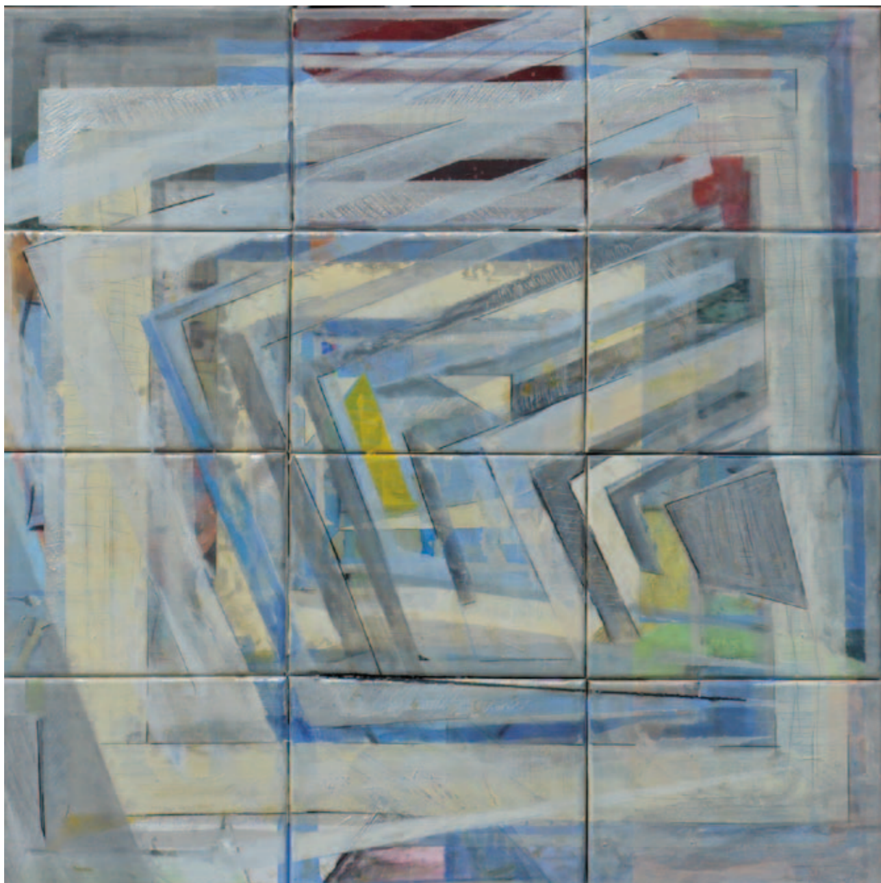
Naila Ibupoto Bez tytułu 72x72 cm akryl na płótnie