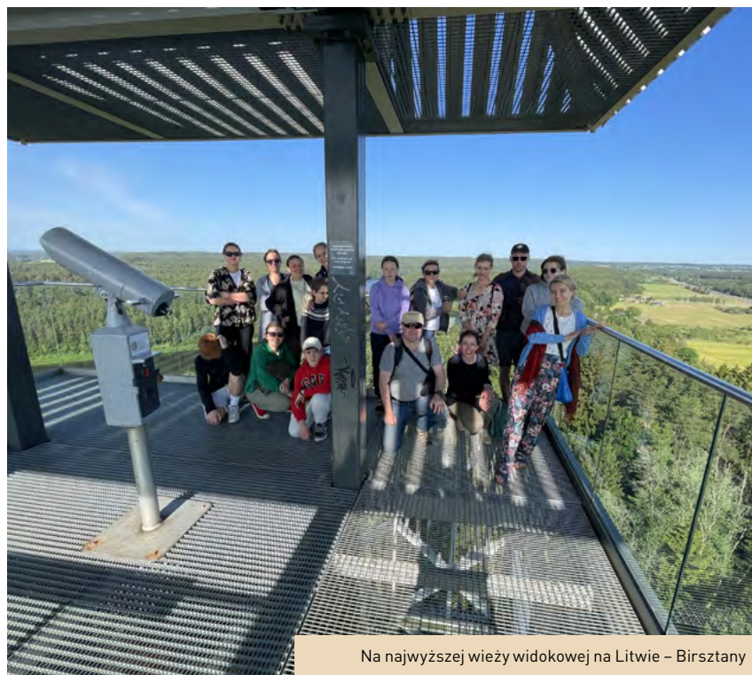
Na najwyższej wieży widokowej na Litwie – Birsztany

Na początku XX w. obserwowaliśmy, jak intensywnie rozwijała się turystyka i rekreacja, jak szybko przybywało podmiotów działających w sektorze turystycznym, bazujących na zasobach dziedzictwa przyrodniczego i kulturowego. Turystyka oparta na przyrodzie i dziedzictwie kulturowym wciąż się dynamicznie rozwija. Zainteresowanie ludzi spuścizną poprzednich pokoleń jest coraz większe, a po pandemii zauważalne stało się dążenie do bycia jeszcze bliżej przyrody. Naszym celem jest przygotowanie absolwentów do odpowiedzialnego, zrównoważonego rozwoju terenów niezurbanizowanych, do budowania atrakcyjnego, odpowiedzialnego społecznie