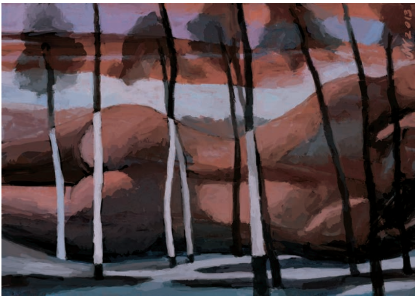
Opuszczony las 84x59 cm, technika własna, 2013