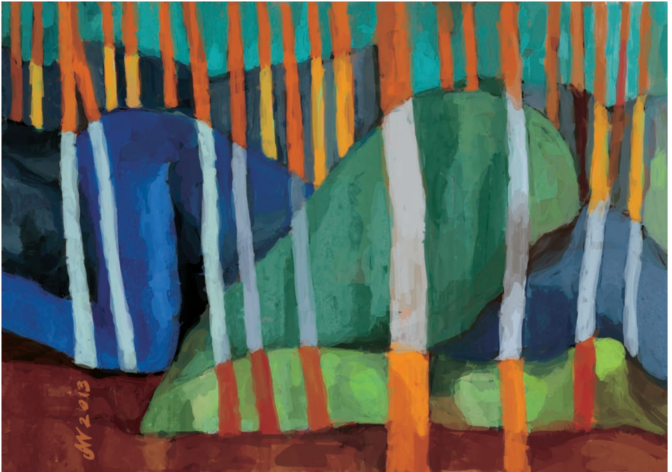
Przed świtem 84x59 cm, technika własna, 2013

pięknu i rozkładowi. Jako naczynie do wypełnienia, twórca wnikliwie odpowiada na sugestie miejsc, w których tworzy. To tylko masa, wpleciona w gnoź życie.