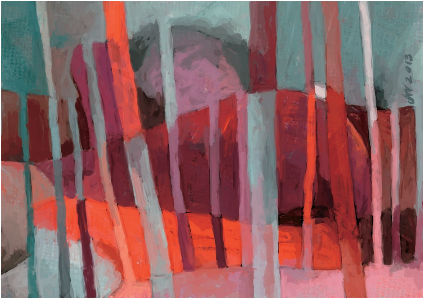
Zastona II 84x59 cm, technika własna, 2013