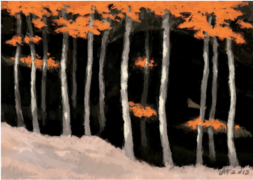
Ciemny las 84x59 cm, technika własna, 2013