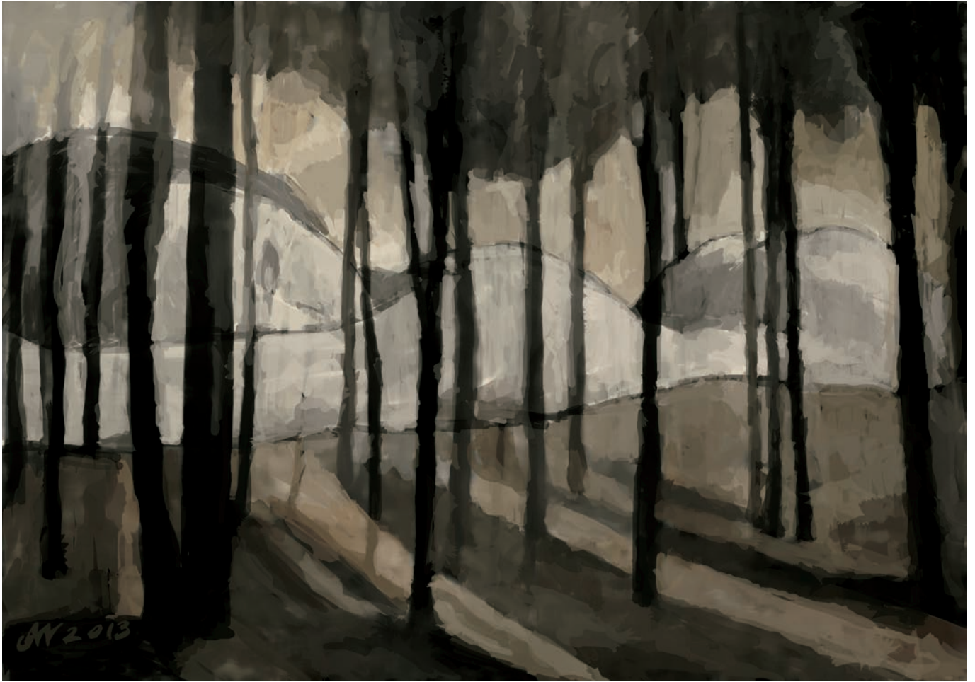
Nostalgia 84x59 cm, technika własna, 2013