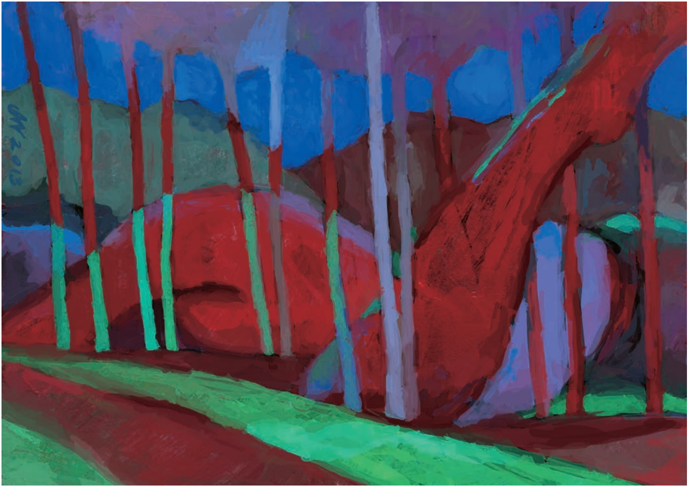
Zmierzch 84x59 cm, technika własna, 2013