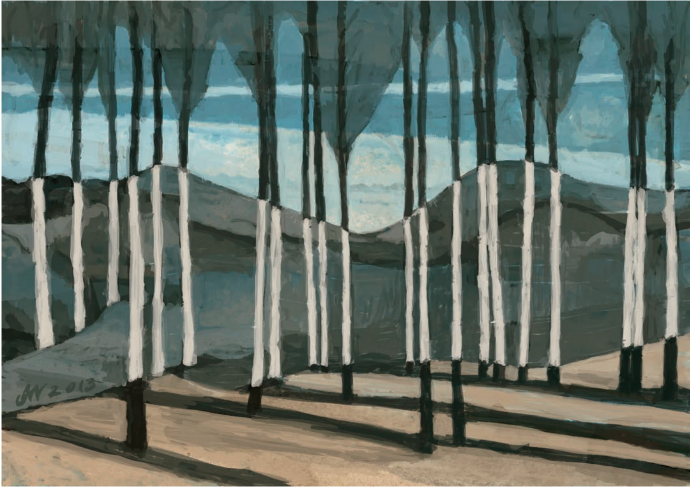
Zastona 84x59 cm, technika własna, 2013