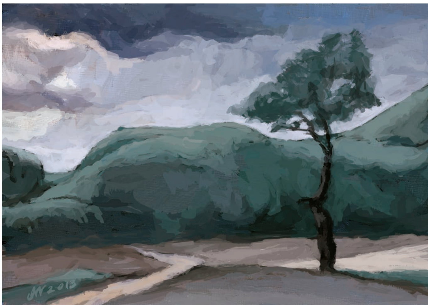
Po burzy 84x59 cm, technika własna, 2013