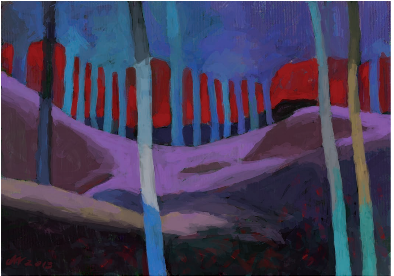
Łuna 84x59 cm, technika własna, 2013