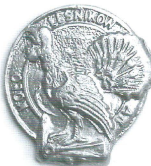
ryc. 9, 10, 11 Znaczki z kolekcji autora.