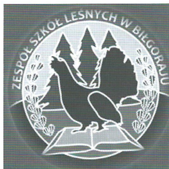
ryc. 15 Logo Zespołu Szkół Leśnych w Biłgoraju