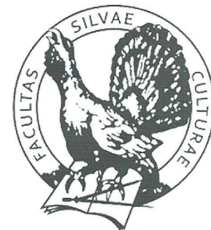
ryc. 13 Oficjalne logo Wydziału Leśnego Uniwersytetu Przyrodniczego w Poznaniu