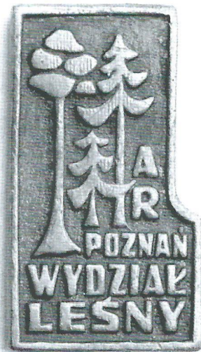
ryc. 16 Znaczek Wydziału Leśnego, tzw. „z sosnami” wybijany w latach 80-tych ubiegłego wieku.