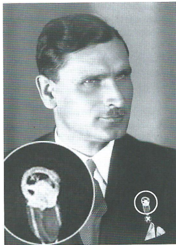
ryc. 17 Brakujący w kolekcji znaczek Koła wybity w 1935 roku na którym widać rzymską XV.