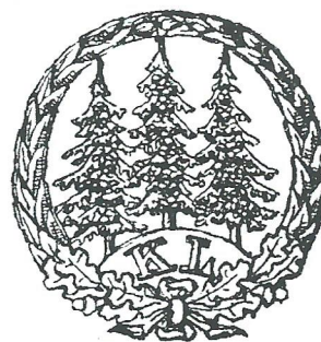
ryc. 3 Logo Koła Leśników Studentów SGGW z okresu międzywojennego

„Koło Leśników Szkoły Głównej Gospodarstwa Leśnego w Warszawie zamierza stworzyć dla swoich członków odznakę i w tym celu ogłasza konkurs. Znaczek ma służyć do noszenia w klapie surduta. Znaczek ma symbolizować godło akademika leśnika. Wielkość znaczka nie powinna przekraczać granic powierzchni koła o średnicy 2,5 cm (...). Praca uznana przez Komisję Konkursową za najlepszą będzie nagrodzona kwotą pieniężną w sumie 10.000 (dziesięć tysięcy) marek polskich” (Biedrzycki 1922).